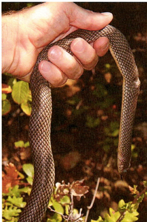
1. kép: Nyakán sérült haragossikló példány, mely a biciklisták által használt ösvényen található üreget használja búvóhelyként.