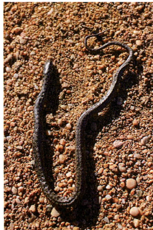
2. kép: A biciklisták által használt ösvényen talált, frissen elütött, idei kelésű példány.